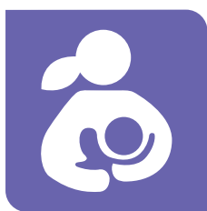
Lactancia materna y alimentación