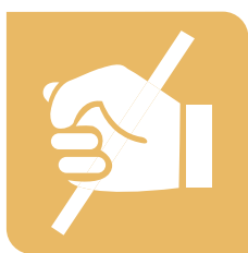
Prevención maltrato infantil