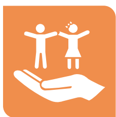
Derechos de las niñas y los niños