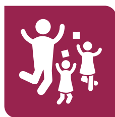
Juego y esparcimiento